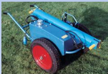
RLH11 138kg* Sklápí stožáry HL330