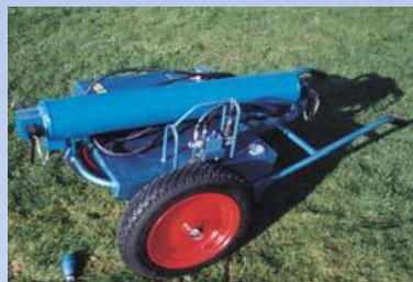
RLH12 153kg* Sklápí stožáry GL400