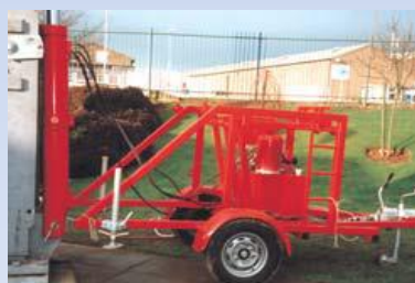
RLH15 1000kg* Sklápí stožáry GL720