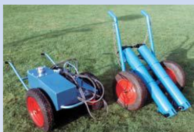
RLH13 hydraul. písty 108kg RLH13 čerpadlo 98kg Sklápí stožáry GL520