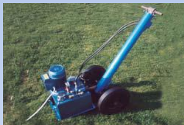
RLH5 108kg* Sklápí stožáry HL250

Hydraulická sklápěcí zařízení ovládaná pomocí elektricky poháněného čerpadla jsou navržena, aby bezpečně umožnila sklopit jim odpovídající typy stožárů, proto se tato zařízení liší dle výšky stožárů a jejich nosnosti ve vrcholu.