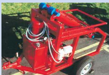
RLH14/RLT 620kg* Sklápí stožáry GL620